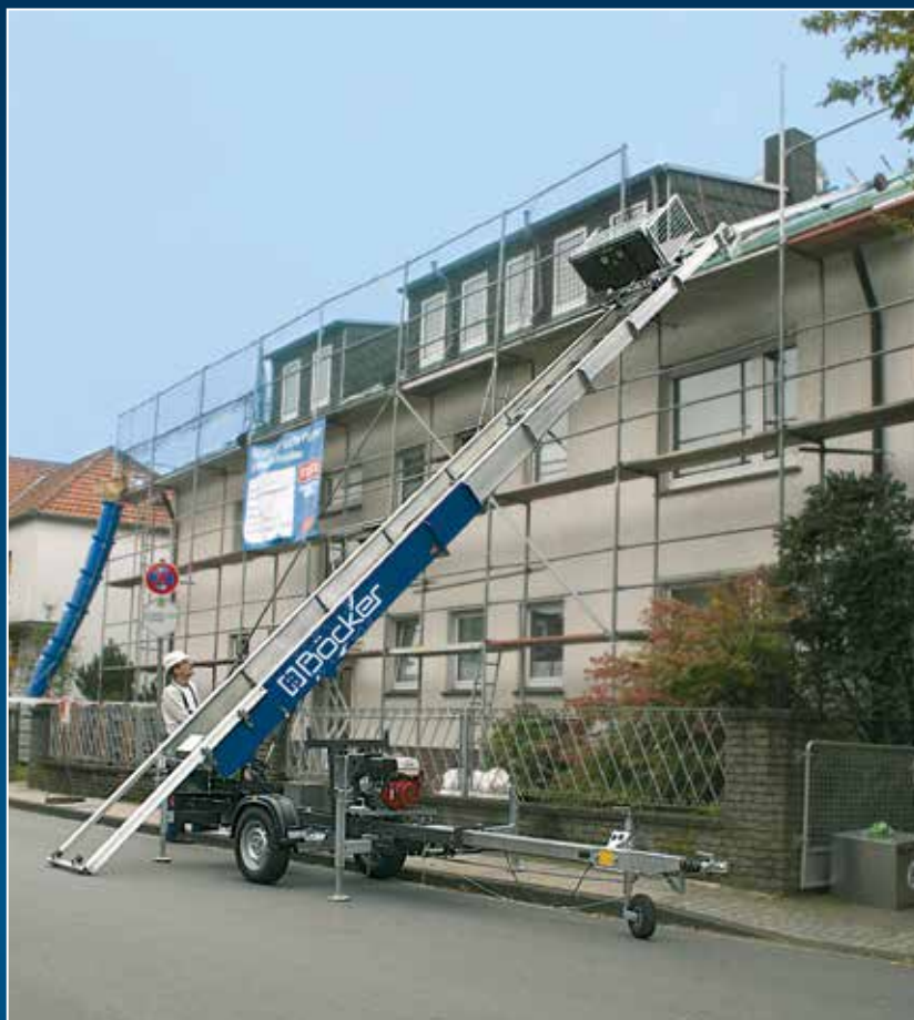
Le JUNIOR en action