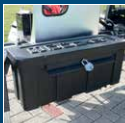
Coffre à outils fermant à clé et généreux (en série)