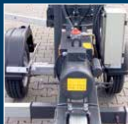
Essieu rétractable, largeur de manœuvre de 0,89 m (en option)