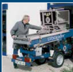
Franchit même une porte standard