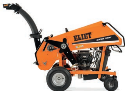
SUPER PROF MAX