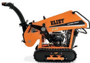
SUPER PROF MAX AUTOTRACTÉ SUR CHENILLES