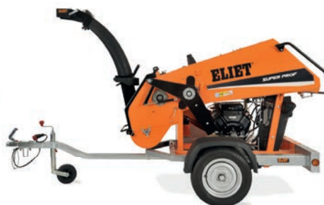
SUPER PROF MAX TRACTÉ SUR REMORQUE